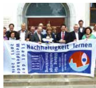
Neumarkt fördert mit dem Programm „Nachhaltigkeit neu lernen“ städtische Mikroprojekte