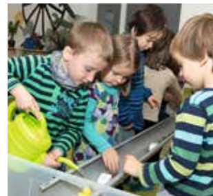
BNE in der KITA in Heidelberg erleben