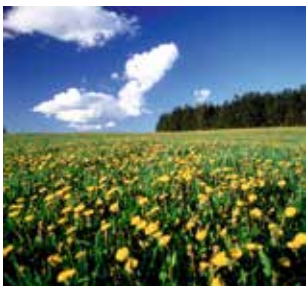
© Conrad Franz Blumenwiese in Hellenthal