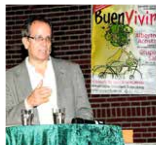
Alberto Acosta stellt sein Konzept des Guten Lebens „Buen Vivir“ in München vor

Bei BNE setzt der Markt Eggolsheim auf die Bewusstseinsbildung seiner Bürgerinnen und Bürger. Entsprechend des Ansatzes des lebenslangen und lebensbreiten Lernens wird jede Altersgruppe individuell angesprochen und als wichtiger Multiplikator ernst genommen.