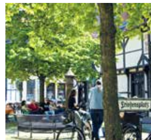
Der Friedensplatz in Minden