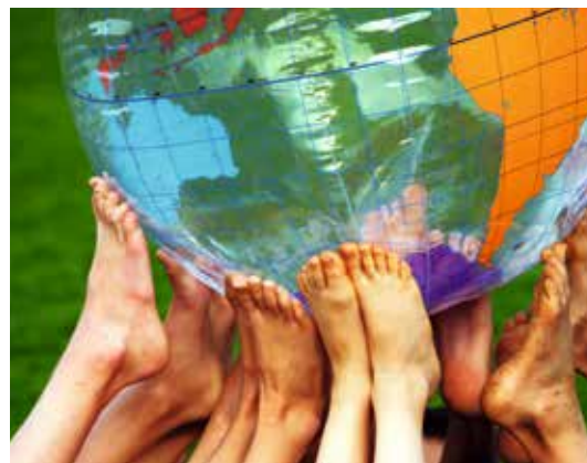
Jedes Jahr sammeln die Kinder in Dornstadt Grüne Meilen für das Weltklima.

Vorsitzender des Nationalkomitees der UN-Dekade „Bildung für nachhaltige Entwicklung“