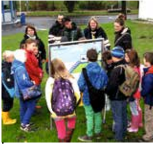
Grundschulkinder aus Hetlingen bei einer Betriebsbesichtigung des azv Südholstein

BNE spielt in Solingen eine wesentliche Rolle. Das zeigen die zahlreichen Projekte und Kampagnen des „Solinger Aktionsprogramms 2013“, z. B. in den Bereichen des Umwelt-, Klima- und Ressourcenschutzes oder der interkulturellen Bildung.