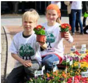
Schüler der BNE-Schule Gymnasium Bürgerwiese bei „Plant for the Planet“ in Dresden