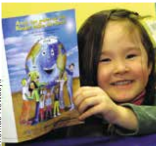
Projekt „Kinderrechte“ des aGENDA-Arbeitskreises Kinder in Gelsenkirchen